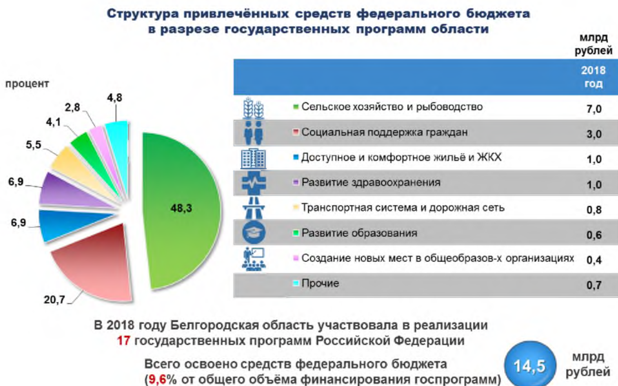
Рис. 5. Привлечение средств федерального бюджета в рамках реализации государственных программ области в 2018 году

Наибольшие объемы федеральных средств привлечены по государственным программам области: «Развитие сельского хозяйства и рыбоводства в Белгородской области на 2014-2020 годы» - 7 млрд рублей, «Социальная поддержка граждан в Белгородской области на 2014-2020 годы» - 3 млрд рублей, «Обеспечение доступным и комфортным жильём и коммунальными услугами жителей Белгородской области на 2014-2020 годы» - 969,5 млн рублей, «Развитие здравоохранения Белгородской области на 2014-2020 годы» - 960,7 млн рублей, «Совершенствование и развитие транспортной системы и дорожной сети Белгородской области на 2014-2020 годы» - 752,2 млн рублей, «Развитие образования Белгородской области на 2014-2020 годы» - 592,5 млн рублей, «Создание новых мест в общеобразовательных организациях Белгородской области на 2016-2025 годы» - 446,4 млн рублей (рисунок 5).