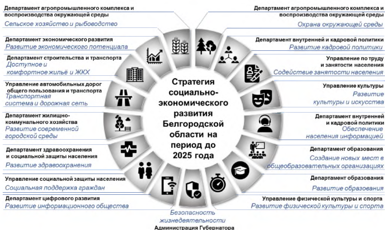
Рис. 1. Ведомственная принадлежность государственных программ области

Программы сформированы по отраслевому принципу в соответствии с Перечнем государственных программ области, утвержденным постановлением Правительства области от 7 октября 2013 года № 401-пп. Ведомственная принадлежность госпрограмм представлена на рисунке 1.