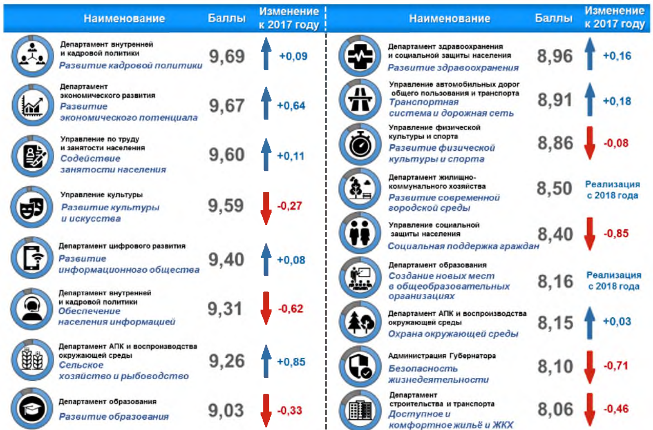
Рис. 8. Оценка эффективности реализации государственных программ области в 2018 году

Информация о проведенном мониторинге и результатах оценки эффективности размещена на официальных сайтах Губернатора и Правительства области по ссылке www.belregion.ru/documents/region_programms.php , департамента экономического развития области по ссылке www.derbo.ru/deyatelnost/strategicheskoe-planirovanie/ .