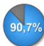
Рис. 3. Ресурсное обеспечение государственных программ области в 2018 году

Доля программных расходов областного бюджета, направленных на реализацию госпрограмм области, в общем объёме расходов областного бюджета