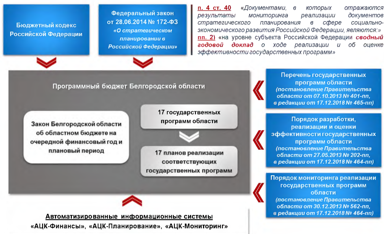
Рис. 2. Нормативная правовая база по вопросам разработки, реализации и оценки эффективности государственных программ области

финансов и бюджетной политики, внутренней и кадровой политики области осуществляется мониторинг реализации государственных программ области.