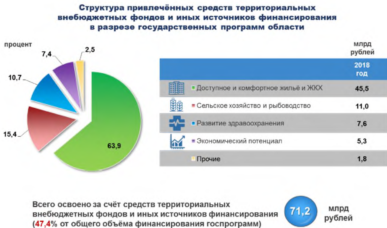
Рис. 6. Информация о привлечении средств территориальных внебюджетных фондов и иных источников финансирования в рамках реализации государственных программ области в 2018 году

2020 годы» - 45,5 млрд рублей, «Развитие здравоохранения Белгородской области на 2014-2020 годы» - 11 млрд рублей, «Развитие сельского хозяйства и рыбоводства в Белгородской области на 2014-2020 годы» - 7,6 млрд рублей, «Развитие экономического потенциала и формирование благоприятного предпринимательского климата в Белгородской области на 2014-2020 годы» - 5,3 млрд рублей (рисунок 6).